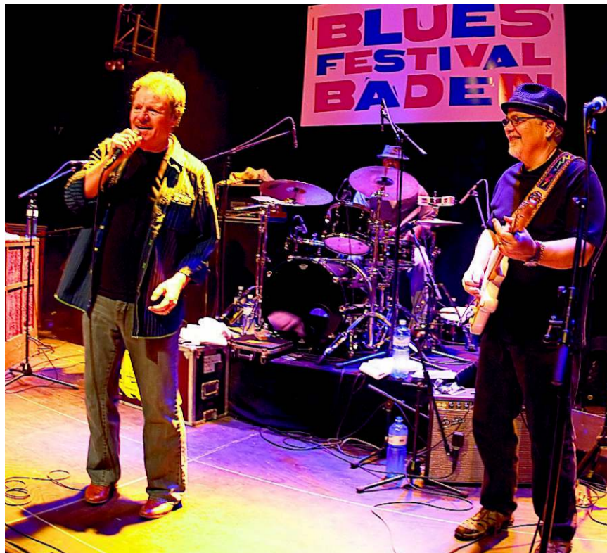
Grossartiger Live-Musiker: Delbert McClinton (l.).